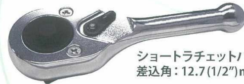
ショートラチェットハンドル 差込角: 12.7(1/2")mm

対象ノズル: 350A用ストレートタイプ WSC350SET 参考価格 12,650円 (税別) 10,780円 (税込) 9,800円 (税別)