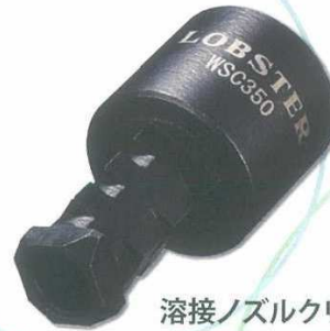
溶接ノズルクリーナー 350A用 or 500A用