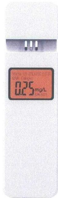
アルコールチェッカー ZT-100

令和4年10月から社用車を運転するのは、アルコール検知器での確認が必要になります。