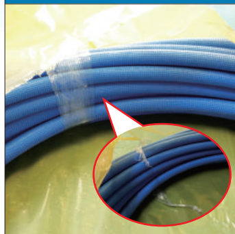
⑥ 保温材付パイプはストレッチフィルムが2~3ヶ所巻いてあるので破ります。