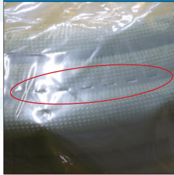
② 梱包袋の両面にミシン目加工があります。