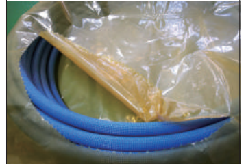
④ 破った部分からミシン目に沿って円形に破ります。