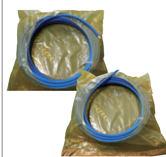
⑦ 巻物の内側からパイプを取り出します。