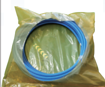
⑤ 円形に開梱します。