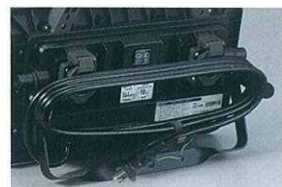
ケーブルラック付アーム 電源ケーブルを束ねて収納