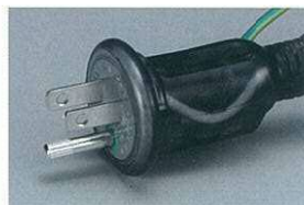
防雨型2P/2P接地付 兼用プラグ付