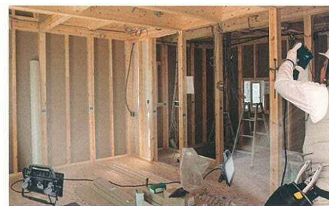
灯体から電源も取れて作業効率がアップ!