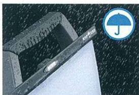
屋外使用も安心の防雨型 IP55の安全設計