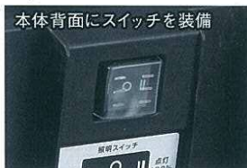
本体背面にスイッチを装備 明るさ2段階切り替え式 使用場所に合わせて調節できます

灯体背面に連結点灯や灯体から電源が取れるコンセント2個付 2P/2P接地付兼用タイプなので、防雨型2P/2P接地付プラグのどちら でも隙間なく接続できます